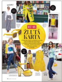
InStyle je každodenní inspirací.

Móda je hravá, styl osobitý a krása nesmrtelná. Přesně takový je i lifestylový časopis InStyle, osobní stylistka a průvodce pro ženy, které mají vkus. Pro ženy, jako jsi Ty!