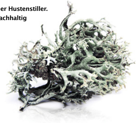
Cetraria islandica Volksname: Isländisch Moos

Namensgeber für den Hustensaft ist die Heilflechte Isländisch Moos. Im Hustensaft enthalten sind Extrakte der Flechte. Diese bilden auf der Hals- und Rachen-schleimhaut eine Schutzschicht und legen sich wie ein Balsam über die Schleimhäute. Die bereits angegriffenen und entzündeten Schleimhäute können sich schneller erholen und ihre ursprüngliche Abwehrkraft wieder herstellen. Darüber hinaus hat Isländisch Moos Eigenschaften, die als natürlicher Schutz gegen Erreger wirken.