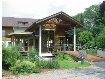
Der Unternehmenssitz im bayrischen Oberlaindern.

In der größten europäischen Produktionsstätte von Avery Zweckform wird Wert auf eine nachhaltige, emissionsfreie Produktion gelegt. Das Unternehmen ist unter anderem deutscher Marktführer bei Etiketten, Formularbüchern und Visitenkarten. Seit zwei Jahren gehört die Marke zur kanadischen Unternehmensgruppe CCL Industries, die auf allen Kontinenten der Erde Standorte hat.