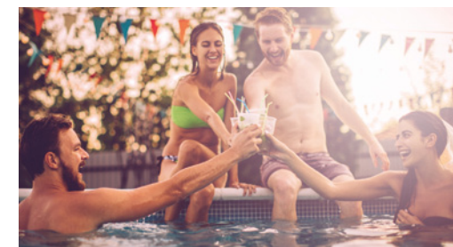
Vodní radovánky s Ledovým Anglānem

A pitný režim je v horkých letních dnech velice důležitý. To vám dává skvělou příležitost o Ledovém Anglānu promluvit a nechat vaše přátele ochutnat, nebo jim při té příležitosti rovnou předejte sáčky s čajem.