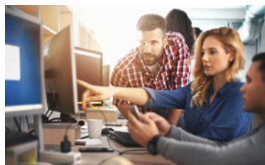
S kolegy v práci.

Nezapomeňte při představování Ledového Anglána ani na své kolegy. Sáček si mohou připravit přímo v práci, stačí k tomu jen voda a za pět minut je hotovo. Při té příležitosti je požádejte o vyplnění dotazníku průzkumu trhu.