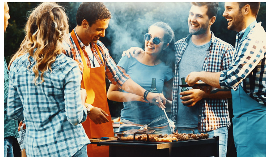
Grilování, zahradní párty

Léto je tady a s ním i všemi milované „grilovačky“ a zahradní párty. Ideální příležitost k přípravě Ledového Anglāna. Anglāna můžete přátelům představit jen tak samotného, ve třech příchutích, nebo jako chutný koktejl. Pro inspiraci jsme vám do startovacího balíčku přibalili kartičku s recepty na přípravu těchto koktejlů. Vaší fantazii se však při přípravě meze nekladou. Dotazníky průzkumu trhu vám jistě všichni s radostí vyplní.