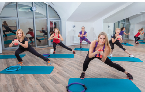
V šatně po cvičení

Hodně z nás tráví v práci velkou část dne a stres či únava a další vnější vlivy se podepisují i na naší pleti. Vezměte několik vzorků Vichy Minéral 89 Hyaluron Booster kolegyním do práce a podělte se s nimi o vaše zkušenosti s boosterem a jeho příznivými účinky.