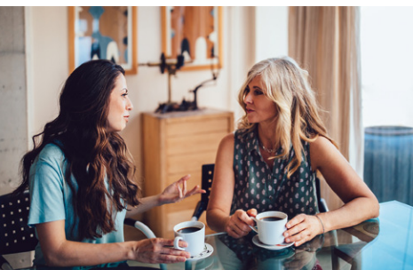
Káva s přáteli

Existuje spousta příležitostí, jak seznámit ostatní s Vichy Minéral 89 Hyaluron Booster. Zde se můžete podívat na několik tipů, jak můžete získané VIP informace sdílet s vašimi přáteli a známými.