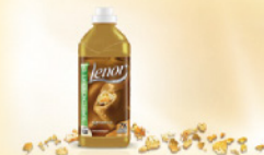
Gold Orchid Kompozycja wanilii i wykwintnych kwiatowych nut