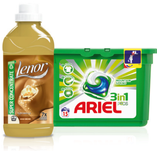
Do doskonałe połączenie środków piorących.

Kapsułki do prania Ariel 3 w 1 tworzą duet idealny z płynem do płukania Lenor, zapewniając doskonałe efekty prania.