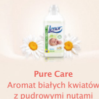
Pure Care Aromat białych kwiatów z pudrowymi nutami