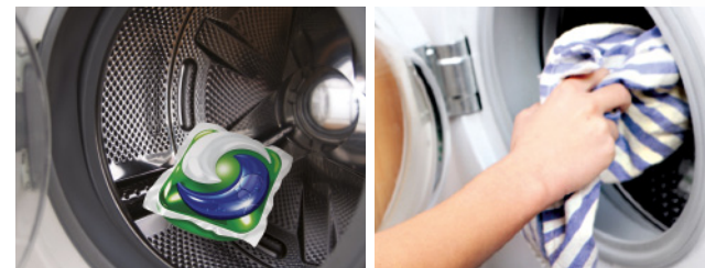
Pranie z Arielem krok po kroku

Aby zapewnić kapsułce maksymalny kontakt z wodą, umieść ją na dnie bębna pralki, a następnie ułóż na niej rzeczy przeznaczone do prania.